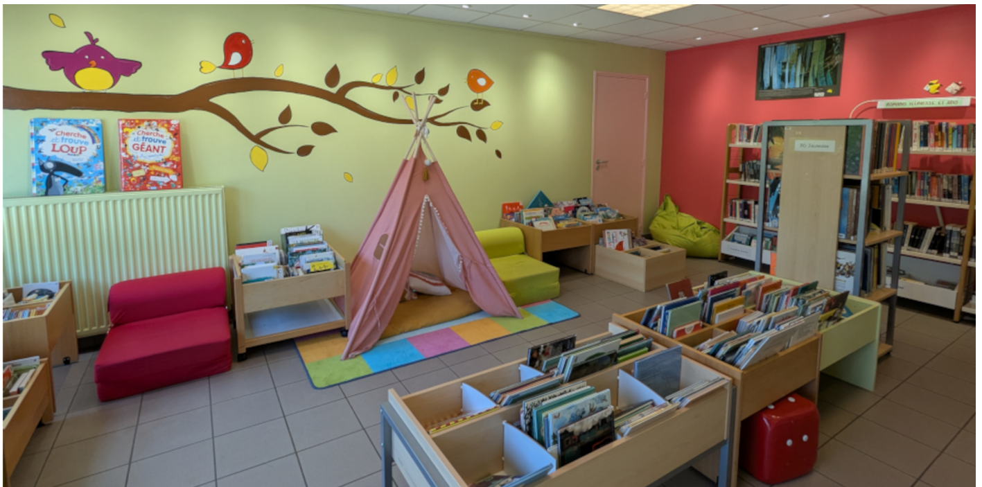
Espace jeunesse Médiathèque