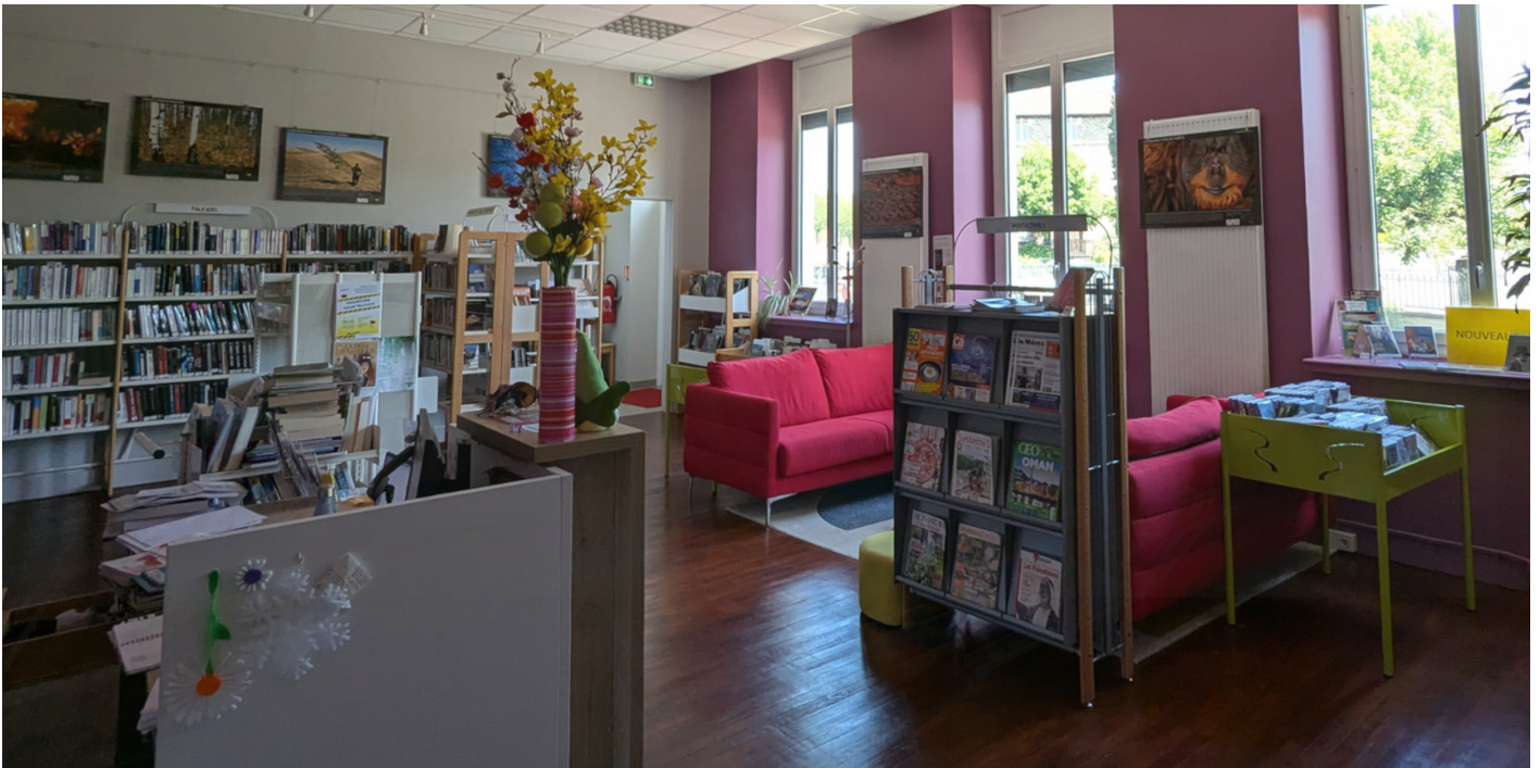
La gare des mots